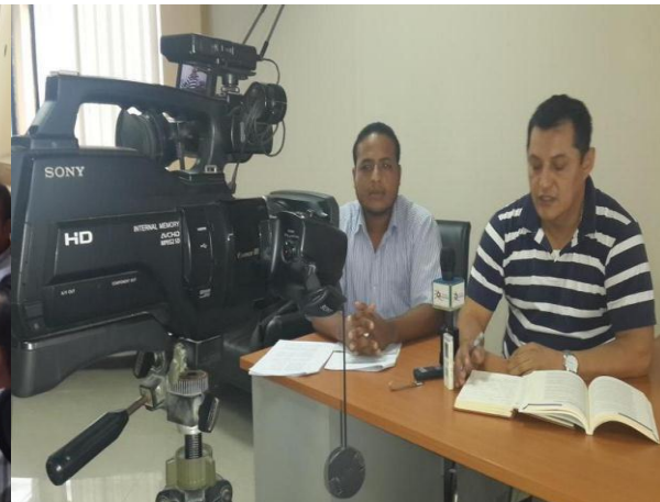
Rueda de prensa sobre Asamblea Participativa.