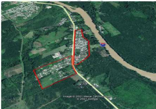
Imagen #1: Área de influencia directa barrio transervis y ciudadela choferes.